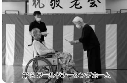
第2ワールドナーシングホーム