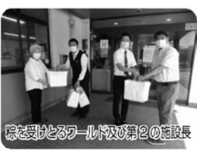
粽を受け取るワールド及び第2の施設長

地元船橋の老舗として、本物の中国料理を提供している「東魁楼」から、新型コロナウイルス感染症拡大の懸念が続く中、介護業務に従事する当法人職員に食べてもらいたいと、8月3日粽がたくさん届きました。 三角形の粽は、東魁楼の人氣メニューのひとつ。もち米と肉、豆等の具材を笹の葉で包み、せいろで蒸しあげた粽を、職員一同、昼食時に美味しくいただきました。 古来、粽は、中国では節句等のお祝い行事のお膳に出されるもので、この味わい深い粽を食べながら、私が感じたことは、新型コロナウイルスに打ち勝つパワーをもらったような気持ちに一瞬、なつたこと です。 世の中が新型コロナウイルスで誰もが減らっている状況が続いているにもかかわらず、介護業務に従事する当法人の職員を慰労し、元気づけるため、まさに絶品の粽をたくさん調理され、わざわざ届けてくれた「東魁楼」の皆さんに、改めて、御礼申し上げます。