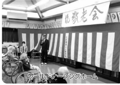
ワールドナーシングホーム